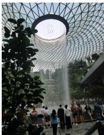
Jewel, Changi Repülőtér