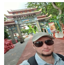
Haw Par Villa