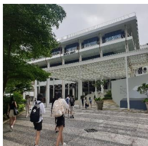
Központi Egyetemi Könyvtár

pótlásra/javításra lehetőség nincs. Ugyanakkor ez mégsem eredményez egy dupla vagy semmi helyzetet, mivel a félévközi értékelések miatt a vizsgák ritkán képviselnek 40%-nál nagyobb súlyt az év végi jegyben. Szintén ezekben az időszakokban volt nagyon is szembetűnő a híres/hírhedt ázsiai mentalitás, amikor is a helyi barátok eltűnedeztek, a kollégiumi társalgók kiürültek, és megteltek a könyvtárak, tanulószobák a kimerültségtől bárhol és bármikor aludni tudó hallgatókkal. Ami még egy jelentős változás volt számomra, hogy az NUS-en sokkal nagyobb hangsúlyt fektetnek a tárgyak keretében elsajátított anyag gyakorlati alkalmazására, mint az ismeretek tényleges számonkérésére. Így kellett a vizsgáim során COVID-19 oltások engedélyezési eljárásáról 1 oldalas értekezést írnom, zöldkémiai szempontból értékelnem egy eljárást vagy klinikai kísérleteket terveznem.