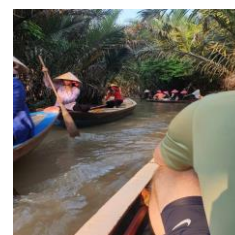
Mekong delta, Vietnám

Mindent összevetve egy igazán tartalmas félévet tölthettem el Szingapúrban, mely során ténylegesen megismerhettem az ottani életstílust, az emberek gondolkodását, mélyebb betekintést nyerhettem a helyi kultúrába és szokásokba. Megtapasztalhattam milyen egy világ élvonalába tartozó egyetemen tanulni, és milyen más tanulási és tanítási megközelítéseket alkalmaznak. Szingapúr mellett lehetőségem volt további kultúrákba is bepillantanom, így például megtapasztalhattam a brunei-i szultánság mesebeli világát, belevethettem magam Hongkong nyüzsgő metropoliszába, és rápihenhettem a vizsgákra Gili szigetén. Nem utolsó sorban megismerhettem helyi és cserediákokat, akikkel felejthetetlen élményeket szereztem, melyek egy életen át velem maradnak. Ezúton is szeretném megköszönni mindenkinek, aki részese volt ennek az 5 hónapnak, illetve lehetővé tette számomra, hogy részt vehessek ebben a programban.