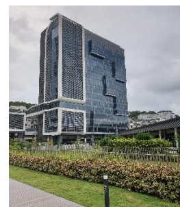
Science 9 épület

Az egyetem több edzőteremmel, medencével is rendelkezik, melyeket a hallgatók egy regisztrációt követően ingyenesen használhatnak, sőt interneten az aktuális kihasználtság is nyomon követhető. Nincs is annál jobb dolog, mint februárban a medence szélén készíteni a beadandókat.