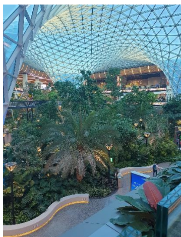
Hammad Nemzetközi Repülőtér

Egy hideg januári hajnal volt, amikor kezdetét vette életem eddigi legnagyobb utazása. A vastag téli kabátot a bukaresti reptérre kikísérő családtagoknál hagyva felszálltam a Dohába tartó gépre. Nem a katarai főváros volt utam végcélja, csupán a mindenképpen szükséges átszállás helyszíne. A rendelkezésre álló idő alatt behatóan megismerkedtem a Hammad Nemzetközi Reptérrel, melyet időközben a világ legjobb reptérének választottak, és e címet épp a repjegyemen végső úticélként feltüntetett szingapúri Changi reptértől hódította el.