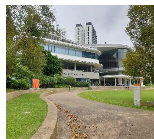
Education Resource Center

A már fentebb említett kollégium az egyetem fő helyszíneként működő Kent Ridge Campus melletti UTown-ban helyezkedett el. Ezen a területen többnyire residential college-ként hívott diákszállások helyezkednek el, melyek az egyetemi tanterven kívüli programokról, és a biztosított reggeliről és vacsoráról ismertek. Meglepő módon, ezek a kollégiumi fogások szolgáltatták számomra a legnagyobb étkezéssel kapcsolatos kultúrsokkokat, úgymint a virsli mellé felszolgált juharszirupos gofri vagy a bagettből készült „pizza”. Ugyanitt tanított meg néhány helyi diáktársam arra, hogy Szingapúrban (és úgy általában Ázsiában) illetlenség villával enni. A villát csak arra használják, hogy az ételt a kanálra segítsék.