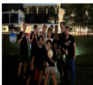
10F Buborékfoci csapat