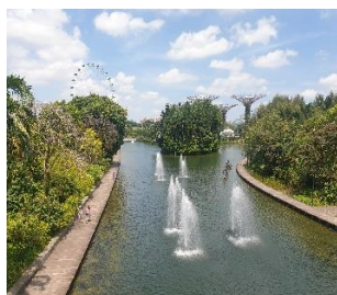
Gardens by the Bay