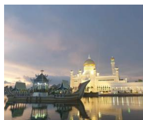
Omar Ali Saifuddien mecset, Brunei