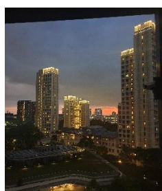
Kilátás a szobámból

Helyi idő szerint reggel 9 környékén landoltam a Délkelet-Ázsia kapujaként is emlegetett reptéren, ahonnan további másfél órás utazás után érkeztem meg a következő néhány hónapra lakhelyemül szolgáló NUS College-ba. A gyors és egyszerű regisztrációt követően elfoglaltam a 10. szinten lévő szobám (Szingapúrban a földszintet 1-es számmal jelölik, így tulajdonképp a 9. emeleten laktam, mint erre pár hét után rájöttem). A szobám ablakából elem tárult látvány minden alkalommal megbabonázott, különösképp a napnyugta környéki órákban.