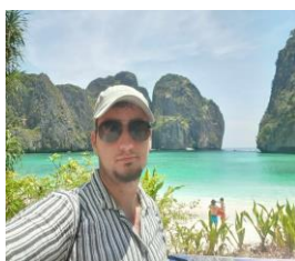
Maya Bay, Thaiföld