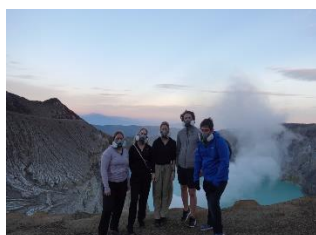
Mount Ijen, Indonézia

Szingapúrból bármely délkelet-ázsiai országba könnyedén el lehet jutni, így akár egy hétvégére is érdemes kirándulást szervezni, hisz mindenképp olcsóbb onnan elutazni mondjuk Vietnámba, mint Budapestről. Hasonló megfontolásból érdemes akár Kuala Lumpur vagy Johor Bahru indulással is tervezni, hisz sokszor onnan indulva lényegesen olcsóbban juthattam el az adott úticélokra.