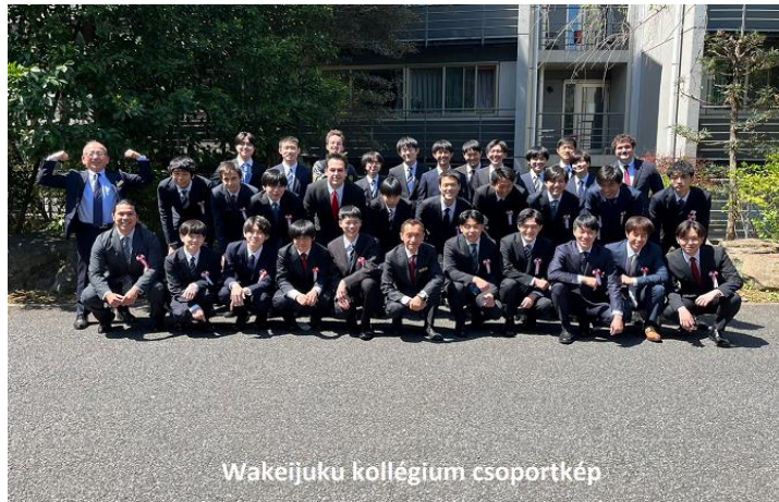
Wakejuku kollégium csoportkép

Lakhatás: A Wakejuku kollégiumban laktam a félév során. Ez egy férfi kollégium, a Waseda egyetem kampuszaitól 10-30 perc sétára. Havonta nagyjából 300 000 forintba került a kollégium, ami egy átlagos árnak mondható ezen a környéken. Külön szobám volt, viszont a fürdő egy, közös, nagy tusoló helyiségből állt az egész kollégium számára. Az ár tartalmazta az étkezést is. A kollégiumban több, érdekes program volt, például éjszakai séta a Yamanoto line vonalán, ami nagyjából 12 órát vett igénybe estétől reggelig. Sport, harcművészet és közösségi tevékenységekben való részvételre is lehetőséget nyújtott a kollégium.