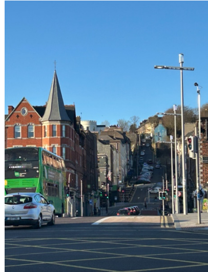
Cork belvárosa – a nyelvtanfolyam helyszíne (a nyelviskola a tornyos épület a jobboldali képen)

A délutáni opcionális programok keretében alkalmam volt megismerni jobban Cork városát, az ír történelem egy szeletét és a tradicionális zenét. Ezek a programok és a csoporttársakkal közös szállás alkalmat teremtett további szóbeli kommunikációra.