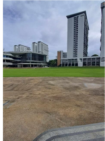
1. ábra: Egyetemi campus (Utown)

kiváló, de több medencéje (amit évközben eléggé kihasználtam hiszen egy utcában laktam a sport központtal), tenispályája, squash és mindenféle egyéb sportolási létesítménye van. Valamint minden faculty-nak külön menza része van, ahol olcsón lehet ételt venni. (Ezek közül nagyon tudom ajánlani a FASS épületeiben található Deck-et, a pandai-os gofrit mindenképp próbáljátok ki.)