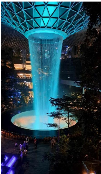
4. ábra: Jewel - Changi reptéren

Néhány random, de fontos információ. Ne felejtsetek el adaptert hozni, ha sokat szeretnétek utazni, akkor érdemes multiadaptert hozni, mert országról-országra változhat, hogy milyen töltőtípus van. A tömegközlekedés nagyon jól ki van építve és revoluttal is simán működik. Bárki is megy ki az próbáljon meg minél többet utazni év közben is és minél hamarabb kezdje el, mert ez a félév nagyon rövid és végig kicsit versenyfutásnak fogod érezni. Ami az én figyelmemet elkerülte először: itt úgy épül fel az egyetemi szemeszter, hogy félév közben 7. héten és az utolsó hét után vizsgaidőszak előtt van egy-egy hétnyi szünet ide érdemes lehet hosszabb utazásokat tervezni esetleg, ha otthonról valaki meglátogat, akkor erre az időszakra tervezni.