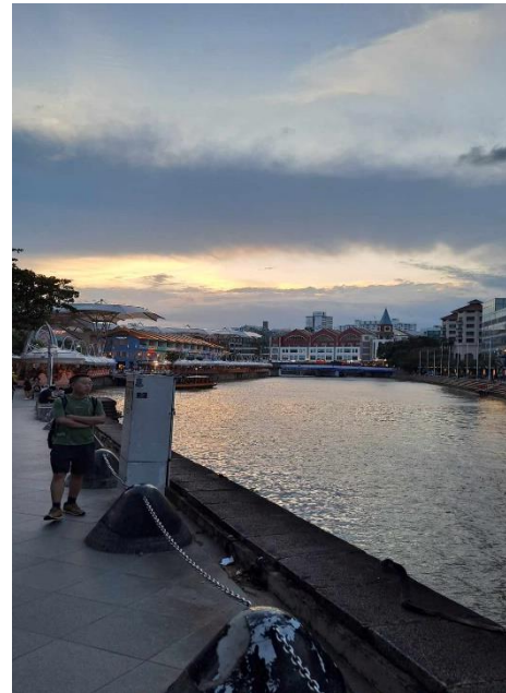
3. ábra: Clark Quay

A kulturális élmények szintén lenyűgözőek voltak. A városban megfordulva megismerhettem a helyi éttermek sokszínűségét és a hawker center-ek forgatagát. A szingapúri kultúra gazdag és sokszínű. A város turistaként szintén izgalmas, de mivel egy városállamról beszélünk ezért egy pár nap/ hét alatt a város fő nevezetességeit meg lehet járni. Számomra Szingapúr, mint 'lakos' sokkal izgalmasabb volt, mint turistaként. Kedvenc helyeim természetesen a Marina Bay és a Botanic Garden volt. Emellett Szingapúrban az a nagyon jó, hogy innen Dél-Kelet Ázsia összes országa könnyen elérhető, amik Szingapúrral ellentétben viszonylag olcsó desztinációk. A legdrágább része ezeknek az utazásoknak a repjegy. Úgyhogy bárki, aki jön majd ide azt kalkulálja bele, hogy olyan olcsón sajnos nem nagyon lehet repjegyet találni, mint amit otthon a ryanair és a wizzair.