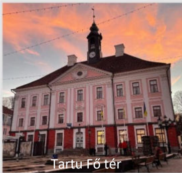
Tartu Fő tér